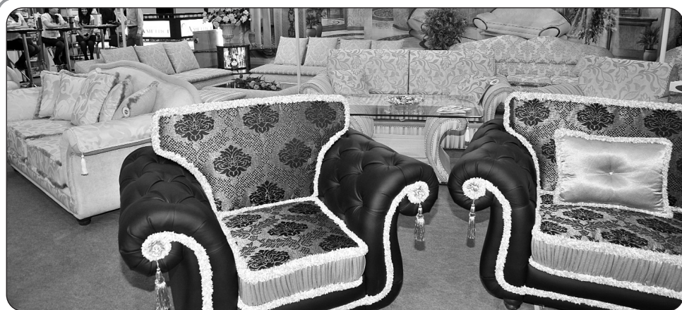
В «Экспоцентре» прошла 23-я Международная выставка «Мебель, фурнитура и обивочные материалы» — «Мебель-2011».

Еще раз подведу итог сказанному. Журналистика — это неустанное стремление тянуть вверх планку духовных запросов людей, делать их зорче и мудрее, просвещеннее и добрее. А обогатить других может лишь тот, кто многое познал сам. Поэтому компетентность журналиста — залог его творческой независимости.