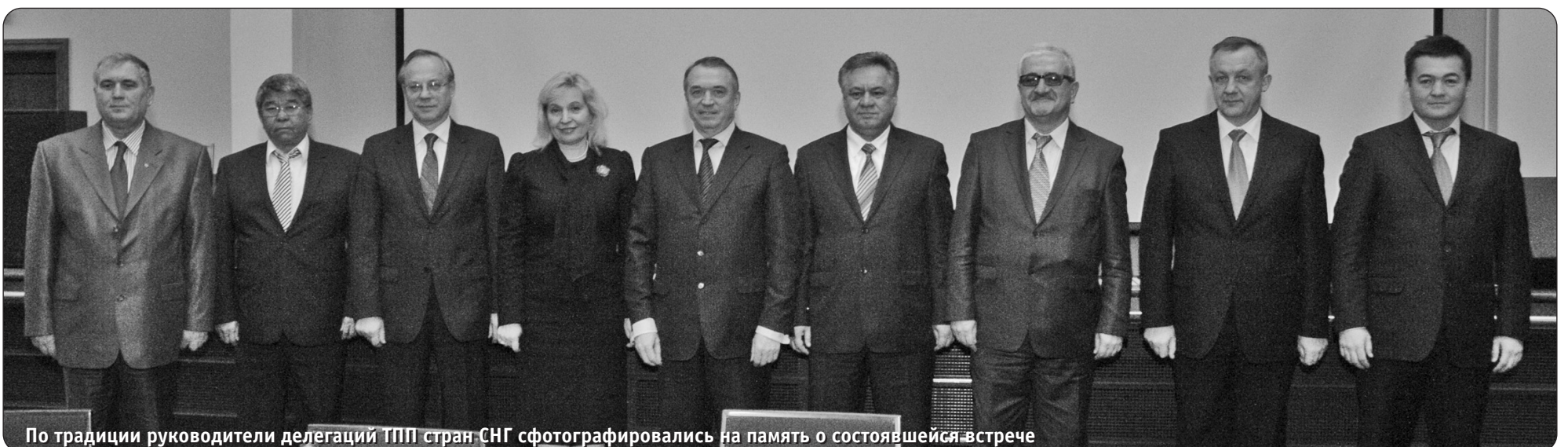
По традиции руководители делегаций ТПП стран СНГ сфотографировались на память о состоявшейся встрече