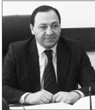
ПРЕЗИДЕНТ: САРКИСЯН МАРТИН ГРИГОРЬЕВИЧ

Торгово-промышленная палата Армении начала функционировать с 1960 года как республиканская палата в единой системе торгово-промышленных палат СССР.