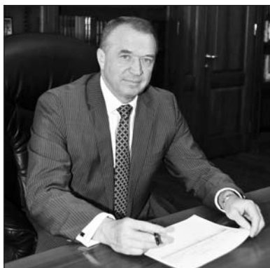
ПРЕЗИДЕНТ: КАТЫРИН СЕРГЕЙ НИКОЛАЕВИЧ

Торгово-промышленная палата Российской Федерации – негосударственная, некоммерческая организация, объединяющая своих членов для реализации целей и задач, определённых Законом Российской Федерации «О торгово-промышленных палатах в Российской Федерации» и Уставом Палаты.