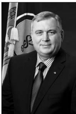
ПРЕЗИДЕНТ: КУКУ ГЕОРГИЙ ИВАНОВИЧ

Торгово-промышленная палата Республики Молдова (ТПП РМ) является юридическим лицом публичного права и в этом качестве пользуется поддержкой государства. С 1991 года ТПП РМ развивает деятельность как независимая и суверенная.