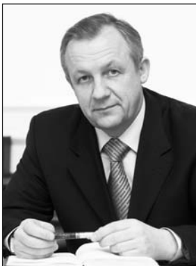
ПРЕДСЕДАТЕЛЬ: МЯТЛИКОВ МИХАИЛ МИХАЙЛОВИЧ

Белорусская торгово-промышленная палата – одно из ведущих деловых сообществ Республики Беларусь, объединяющее весь спектр белорусского предпринимательства, от представителей малого бизнеса до крупных предприятий, холдингов, министерств и комитетов. Сегодня в рядах БелТПП более 1800 членов, включая 10 компаний из Китая, России, Польши и Бельгии. Предприятия с государственной формой собственности составляют 16%, с частной – 84%, в том числе 3,5% – индивидуальные предприниматели, 51% – предприятия малого и среднего бизнеса с численностью сотрудников до 150 человек.