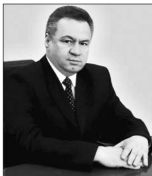
ПРЕДСЕДАТЕЛЬ: САИД ШАРИФ

Торговая палата Таджикской ССР была образована в 1960 году и непосредственно подчинялась правительству республики. Её основной целью и задачей было содействие развитию и укреплению экономических связей Таджикистана с зарубежными странами, а также развитию торговли и промышленности в республике.