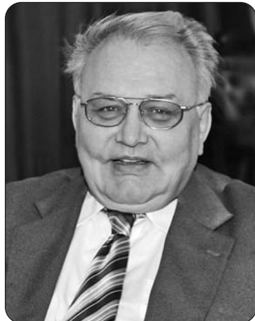
палату СССР, Вы расширили сеть зарубежных представительств Палаты,

активно способствовали развитию системы торговых-промышленных палат и их услуг.