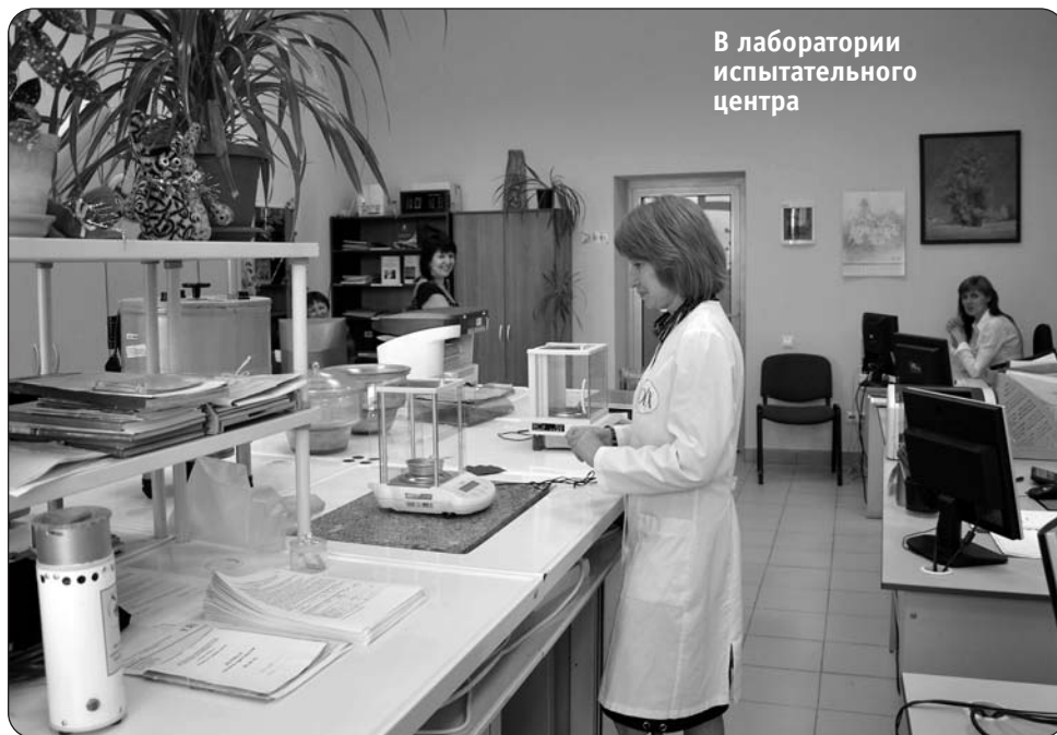
В лаборатории испытательного центра