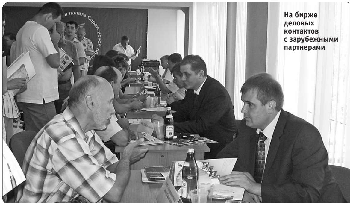
На бирже деловых контактов с зарубежными партнерами

Формирование двустороннего диалога бизнеса и власти, содействие развитию предпринимательства, и в первую очередь малого и среднего, является важнейшим вкладом в повышение качества жизни в регионе и роста его конкурентоспособности».