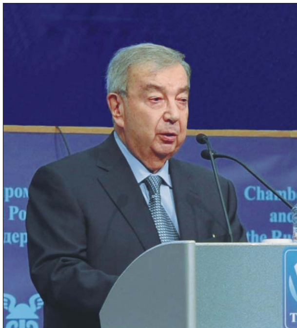
Доклад съезду президента ТПП РФ Евгения ПРИМАКОВА

Главная из них сегодня — это необходимость