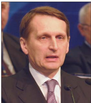
Сергей НАРЫШКИН, руководитель Администрации Президента Российской Федерации

Сергей Нарышкин огласил приветствие Президента России Дмитрия Медведева участникам и гостям съезда, которое было встречено аплодисментами.