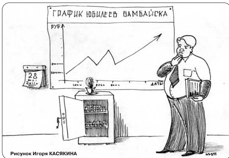
Рисунок Игоря КАСЬКИНА

* Это утверждение губернатора близко к правде. Член Совета Федерации Н. Тонков утверждает: «У нас (регионов. — Ред.) один способ получить дотации (в дорожный фонд. — Ред.) — это круглая дата». (Цит. см. «Аргументы и факты», № 18, 2011, с. 2).