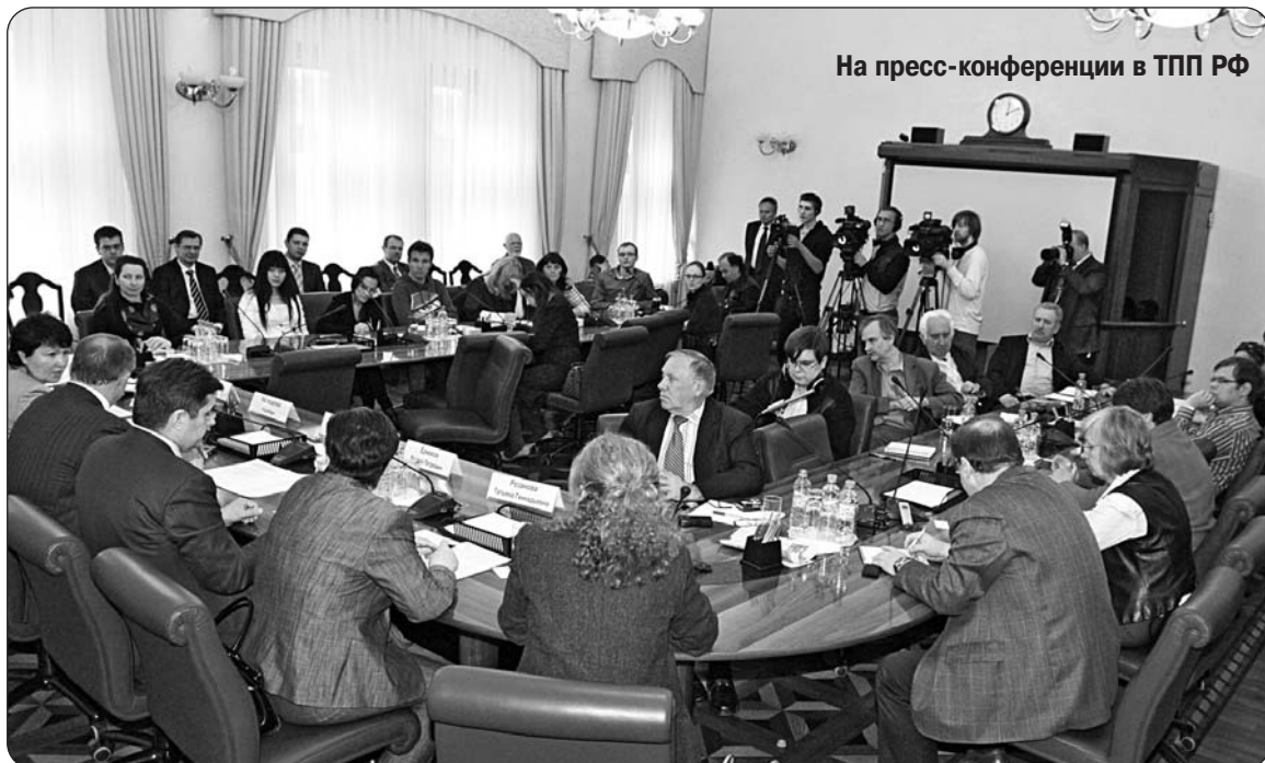
На пресс-конференции в ТПП РФ

В конгресс-центре ТПП РФ в рамках визита Президента Австрийской Республики Хайнца Фишера состоялся Российско-австрийский бизнес-форум.