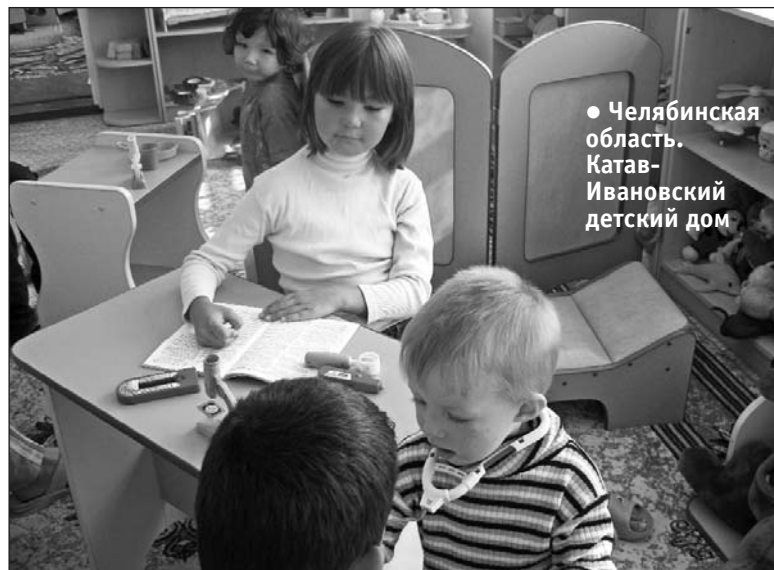
● Челябинская область. Катав-Ивановский детский дом

По решению Генеральной ассамблеи ООН 15 мая во всем мире отмечается День семьи. У нас в стране в этот день вручается Национальная премия общественного признания «Семья России». Фонд совместно с департаментом ТПП РФ по работе с территориальными палатами представил кандидатуры 34 многодетных приемных семей для участия в проекте Национальной премии «Семья России — 2010». Лауреатами