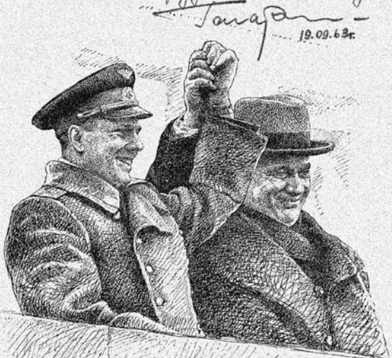
Москва, Красная площадь, 14 апреля 1961 года. Никита Сергеевич Хрущев и Юрий Гагарин на трибуне Мавзолея.

Всякий труд большой или маленький, если он совершается на благо человечества, благороден. Я считаю, что в этом труде есть и моя доля.