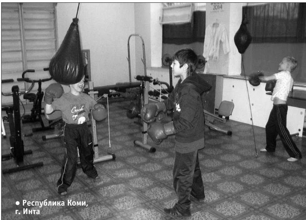
● Республика Коми, г. Инта