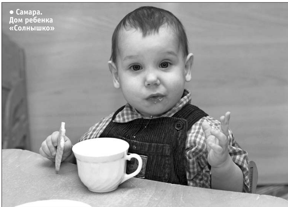
● Самара. Дом ребенка «Солнышко»