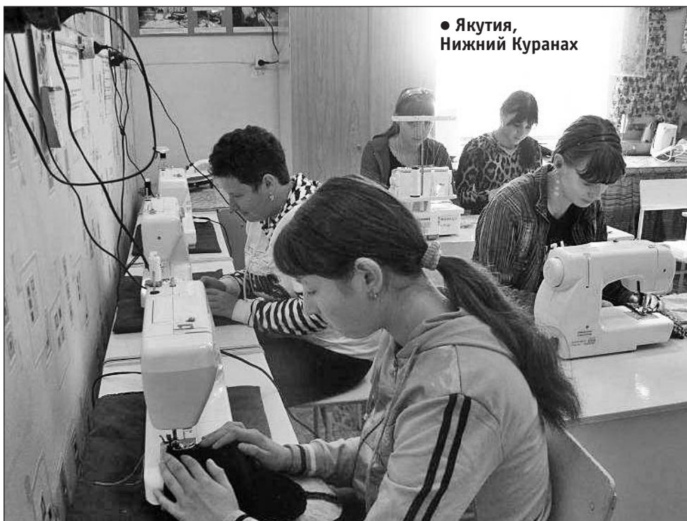
● Якутия, Нижний Курамах