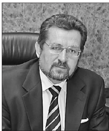
Иван БЛИЗНЕЦ, председатель комитета ТПП РФ по интеллектуальной собственности, ректор Российской государственной академии интеллектуальной собственности (РГАИС)

На разных уровнях продолжаю отстаивать: необходимость формирования нормативно-правовой базы сферы творческого образования в части уточнения его специфики; определения правового статуса и нормативной базы деятельности образовательных учреждений культуры и искусства в общей системе российского образования; сохранения и развития сложившейся сети и контингента образовательных учреждений культуры и искусства.