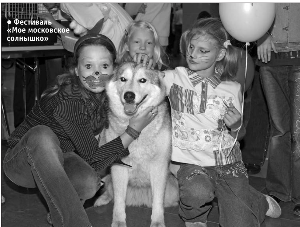
● Фестиваль «Мое московское солнышко»