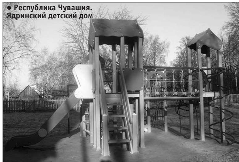
● Республика Чувашия. Ядринский детский дом